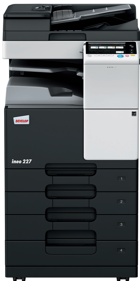
ineo 227 con alimentatore automatico (DF-628), separatore lavori (JS-506) e cassetto carta (PC-213)