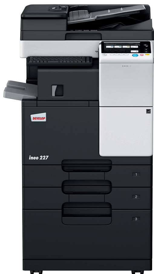
ineo 227 con Alimentatore documenti (DF-628), Finisher interno (FS-533), Mobbiletto con cassettone (PC-413) e supporto per tastiera (KH-102)

Uffici, scuole, università, studi di architettura o di ingegneria, agenzie di assicurazioni, banche, biblioteche, librerie: molte aziende e organizzazioni di medie e piccole dimensioni non necessitano realmente del Colore. Ciò di cui i loro utenti hanno realmente bisogno è un sistema multifunzione monocromatico, facile da usare e che offra accessi mobile per il crescente numero di utenti mobile all'interno degli uffici.